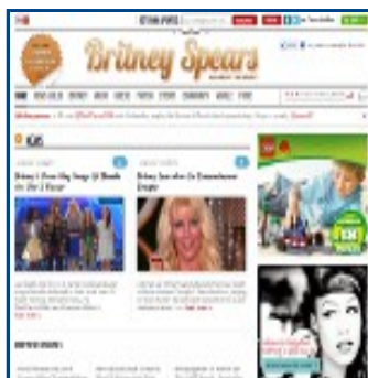
Web de Britney Spears