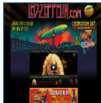
Web de Led Zeppelin