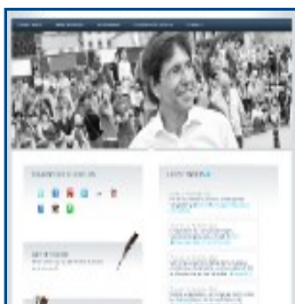
Primer Ministro (Bélgica)