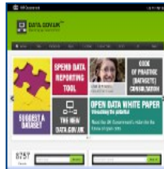
Gobierno Reino Unido