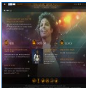
Web de Michael Jackson

Algunas webs del mundo del ocio y del arte desarrolladas completamente con el gestor de contenidos Drupal