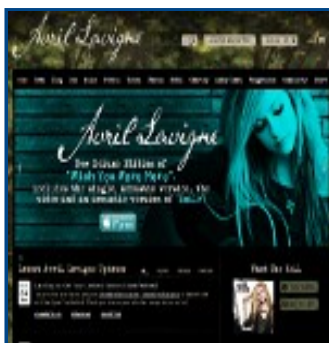
Web de Avril Lavigne