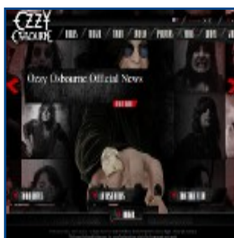
Web de Ozzy Osbourne