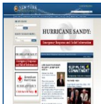
Senado de Nueva York