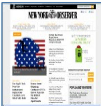
The New York Observer