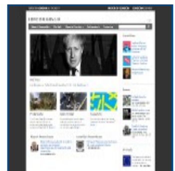
The City of London