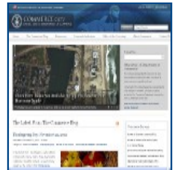
US Department of Commerce