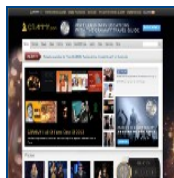
Los premios Grammy