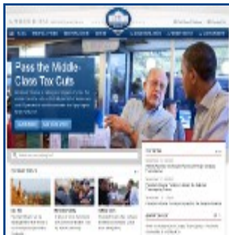
La Casa Blanca (EEUU)

A continuación tenéis las páginas web de diversos Gobiernos, Administraciones y otros Organismos Gubernamentales.