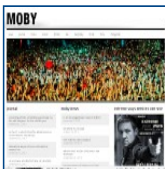
Web de Moby