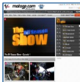
Moto GP Official Web Site