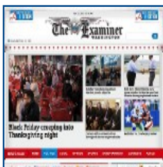
The Washington Examiner