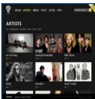
Warner Bros Records