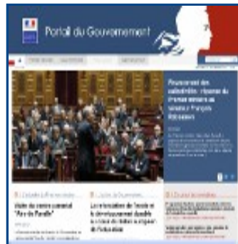
Gobierno de Francia