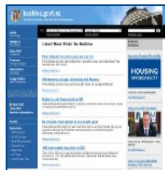
Gobierno Nueva Zelanda