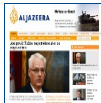
Al Jazeera Balkans